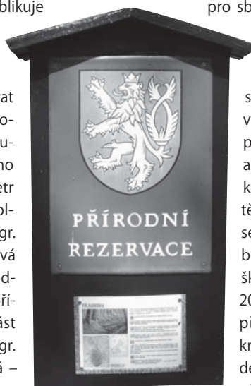
Přírodní rezervace Kolébky