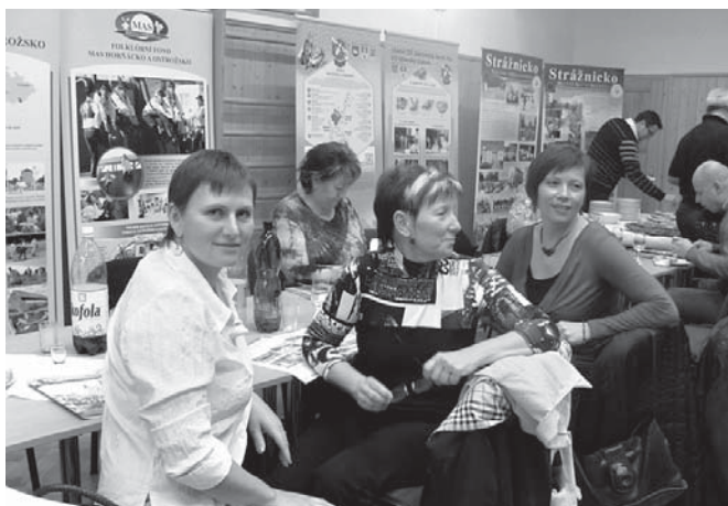
Vinařky z Blatnice pod Svatým Antonínkem