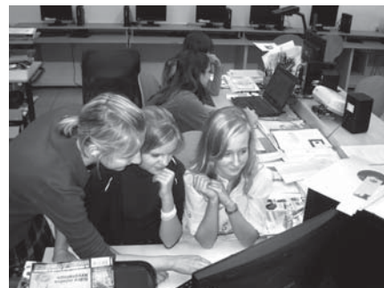
Členové historického kroužku při hledání informací