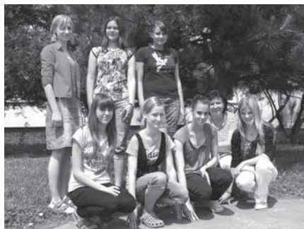
Členové historického kroužku