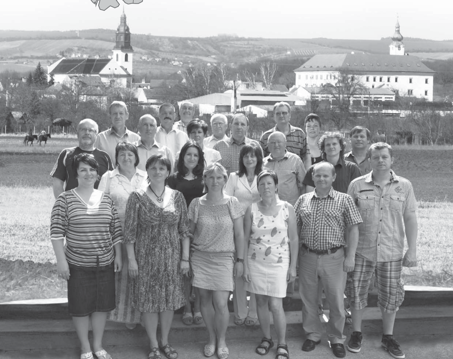
Členové Místní akční skupiny Hornácko a Ostrožsko