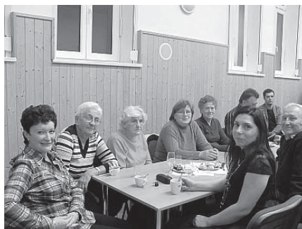
Šikovné děvčice, které napekly novoveské speciality