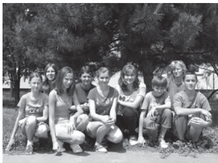
Členové přírodovědného kroužku