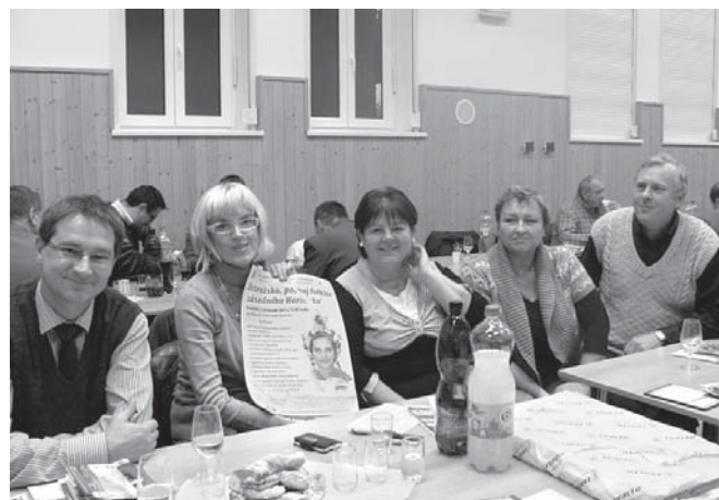
Návštěva z MAS Strážnicko