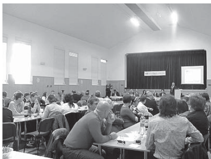
Slavnostní zahájení v Orlovně

Všem, kteří se na akci podíleli, i těm, kteří si udělali čas a přijeli se k nám podívat, patří velké poděkování.