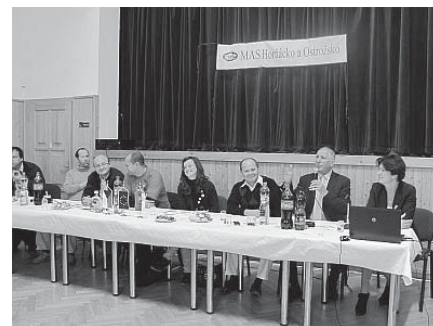
Pan starosta hostitelské obce přeje všem dobrou zábavu