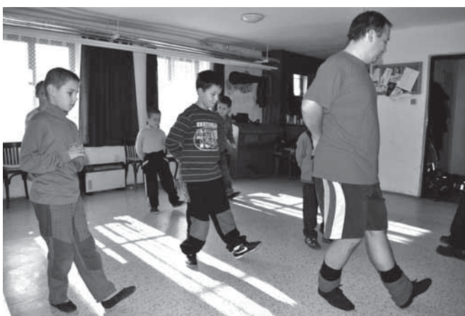
DFS Kameňáček, Ostrožská Lhota

V našich zkouškách hrajeme mnoho skladeb, doprovázíme Vavřínek s novým pásmem, ale vždy se těšíme na tu část zkoušky, kdy se budou hrát verbuňky.