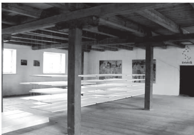
Hornácké múzy, Velká nad Veličkou

Strážné hůrce. Dvacáté století na otázku po smyslu umění v dialogu tvůrců a estetiků odpovědělo: Úkolem umění je ozvláštňovat každodenní život člověka a občerstvovat jeho vnímání. Ať už odcházeli návštěvníci výstavy ze Mlýna spokojení, nebo s otázkou po smyslu celé akce, zanechala v nich výstava dojem, ozvláštnila jejich letní dny. Na rozdíl od televize, která většinou svého vysílání nezklame, ale ani nějak výrazně nezaujme, a především neurazí, protože se zaměřuje na univerzálního diváka, jsou výtvarná díla, která jsme mohli vidět na Válcovém mlýně, individuálnější. Nechtějí se zalíbit, jsou realizací nápadu, vyjádřením osobního pocitu, nálady, názoru, myšlenky. Lze zde použít malého přirovnání – pokud si zajdete do hospody na fotbal či na koupaliště, nebudete si rozumět s každým, koho potkáte. Narazíte ale na lidi, kteří jsou vám sympatičtí, a můžete navázat dobré přátelství. A podobně se málokomu mohly líbit všechny exponáty Hornáckých múz. Každý návštěvník si ale mohl najít dílo, které bylo zajímavé pro něj samotného. Setkání s neotřelým nápadem či neobvyklým úhlem pohledu je zkrátka zážitkem, obzvláště pokud se na chvíli zastavíme a přijdeme na to, co by dané dílo mohlo znamenat nebo proč nás oslovuje. Jsme rádi, že skrze Hornácké múzy můžeme obohatit kulturní a společenský život našeho regionu a udělat ho zajímavější pro návštěvníky zvenčí“.