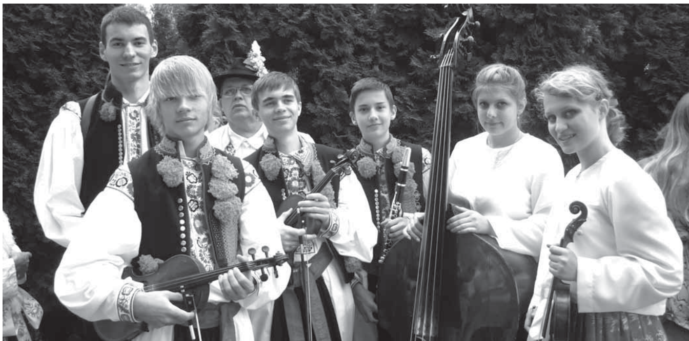
CM Blatnická Studánečka, Blatnice pod Svatým Antonínkem