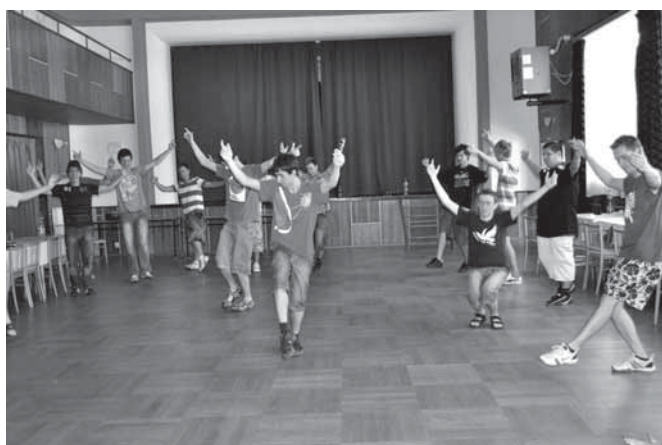
FS Háječek, Ostrožská Lhota