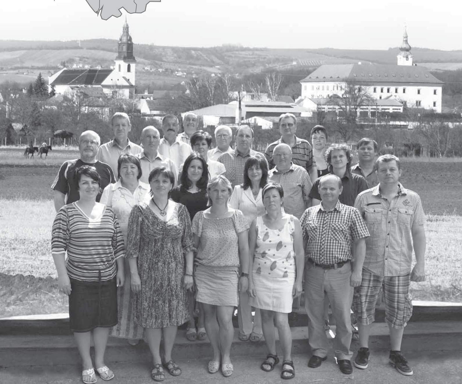
Členové Místní akční skupiny Hornácko a Ostrožsko

Vyhlašujeme výzvu Folklórního fondu MAS na rok 2012