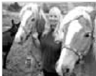
HRUBÁ VRBKA 38 - Vyjeli jsme na velmi zajímavou Hornáckou farmu