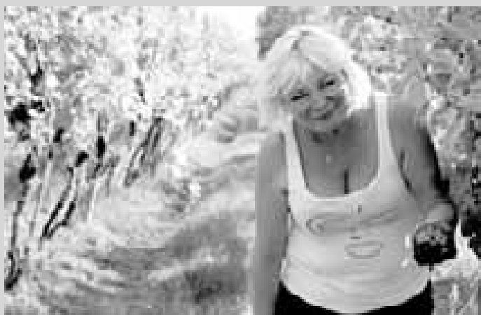
Vinohrady na Antonínku, žena z Nové Lhoty při práci.

Podle kalendáře se zdá, že podzim je rovnocenný s jarem, létem i zimou. Jenže ve skutečnosti je tomu jinak, podzim je určitě nejkratší, nenápadně začíná a ještě nenápadněji končí - po pár týdnech je fuč. I náš časopis se s podzimem téměř mívá, jedno číslo vychází v září, kdy je ještě příjemné letní teplo, a další už v listopadu, kdy je téměř zima.