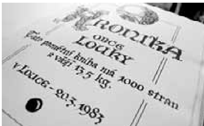
Tady je vůbec první stránka první ze dvou kronik.

umístit na internet. Byla by to sice dlouhá práce, ale nestála by téměř žádnou korunu.