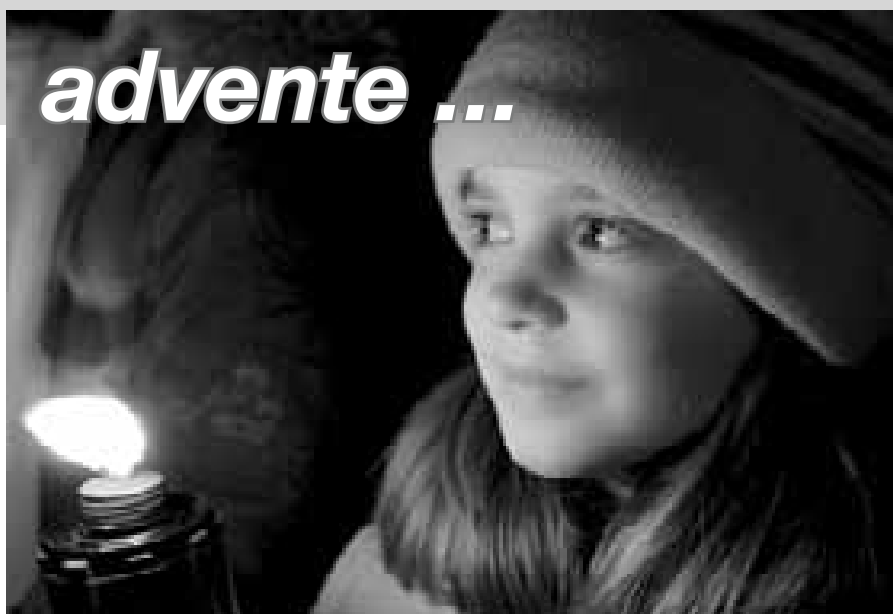
Ranní roráty, prosinec 2009, Slovácko

Venku bude tma, před zimou se už budeme chránit teplou bundou či kabátem, a možná se už bude nad ránem, ve světle nočních lamp, třpytit první sníh. Takové budou zřejmě následující prosincové dny, kdy se bude blížit advent a děti půjdou na roráty.