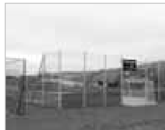
PŘÍLOHA MAS 34 - Ukážeme vám realizované projekty, podpořené MAS

Krajem svatého Antonínka , regionální periodikum, povoleno Ministerstvem kultury ČR