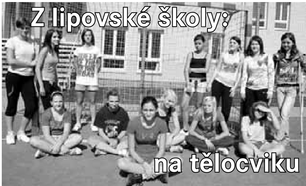
Žákyně osmé a deváté třídy ze Základní školy v Lipově. Takto zapózovaly po skončení hodiny tělocviku.

Na této skupinové fotce můžete vidět většinu žáků osmé a deváté třídy v Lipově. Ač nepřilíší rády, shromáždily se takto k focení po hodině tělocviku, kterou vedl sám ředitel školy.