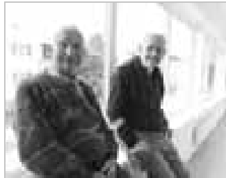
UHERSKÝ OSTROH 23 - Byli jsme na otevření Domova seniorů