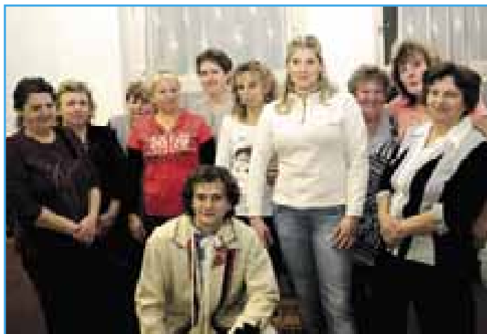
Tady je většina těch, kteří v listopadu připomínali sáharskou tradici předků. Třeba v ní budou pokračovat i tito dva mladí kluci.