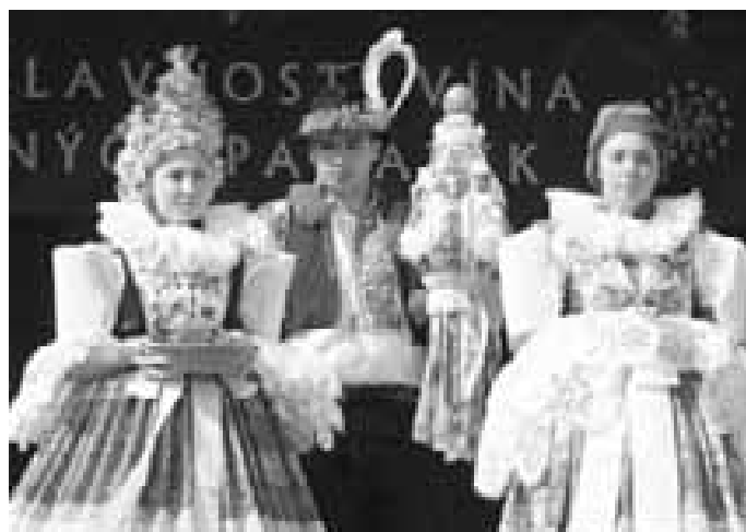
Součástí slavností byla i velká krojovaná přehlídka. Vlevo jsou krojovaní z Ostrožské Lhoty, vpravo z Ostrožské Nové Vsi.