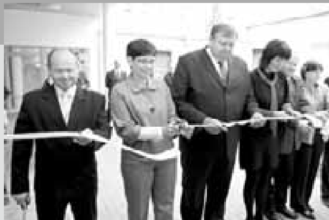
Na fotce můžete vidět slavnostní otevření domova, kterého se účastnil i hejtmán Zlínského kraje.

Historie domova přitom sahá až do roku 1992. Tehdejší budova jesli byla přestavěna nejdříve na domov pro devět důchodců a ordinaci obvodní lékařky. V roce 1994 byl tento domov vylepšen a míst už bylo osmnáct. A v roce 2008 začala nynější zásadní mo-