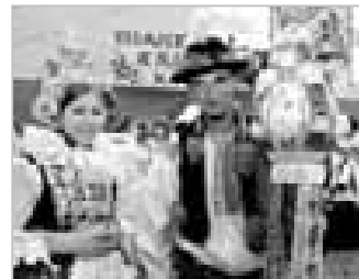
OSTROŽSKÁ NOVÁ VES 12 - Zajímali jsme se, co to obnáší mít doma stárka