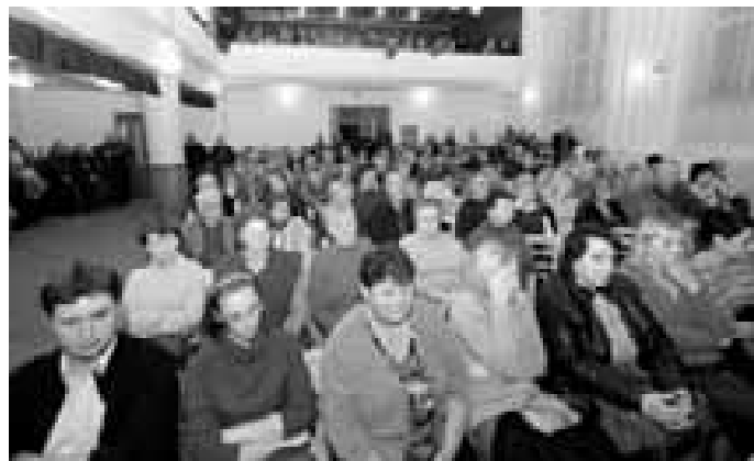
Největší zájem o ustavující zasedání zastupitelstva byl v Blatnici pod Sv. Antonínkem, kde byl plný kulturák, včetně galerky. Naopak, v některých obcích nepřišel skoro nikdo.