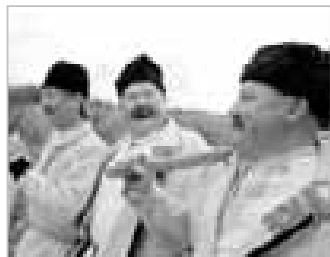
NOVÁ LHOTA 14 - Zúčastnili jsme se vzpomínání na hornácké Sáhary