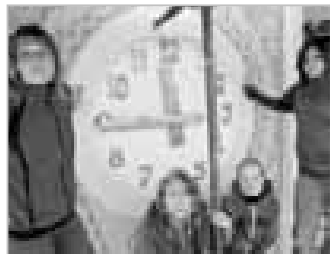
UHERSKÝ OSTROH 10 - Sledovali jsme restaurování cenné zvonice