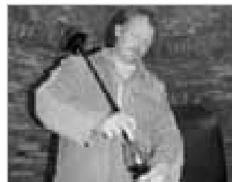
LIPOV 26 - Jeli jsme se podívat za lipovským vinařem