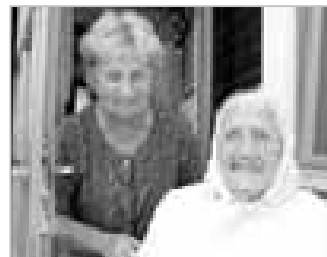
OSTROŽSKÁ LHOTA 20 - Besedovali jsme s nejstarší ženou v Ostrožské Lhotě