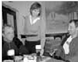
VELKÁ NAD VELIČKOU 16 - Obdivovali jsme historii velického Hostince U Kotášků