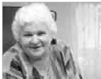
LOUKA 21 - Prohlíželi jsme si unikátní kroniku Louky