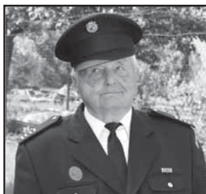
Ostrožská Nová Ves 28 Jubilant