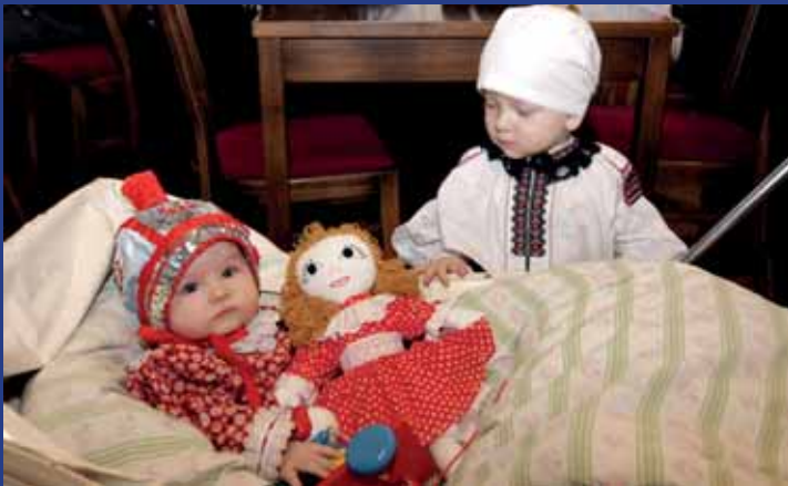
Na Dětský krojový ples v Hluku přišli i ti nejmenší