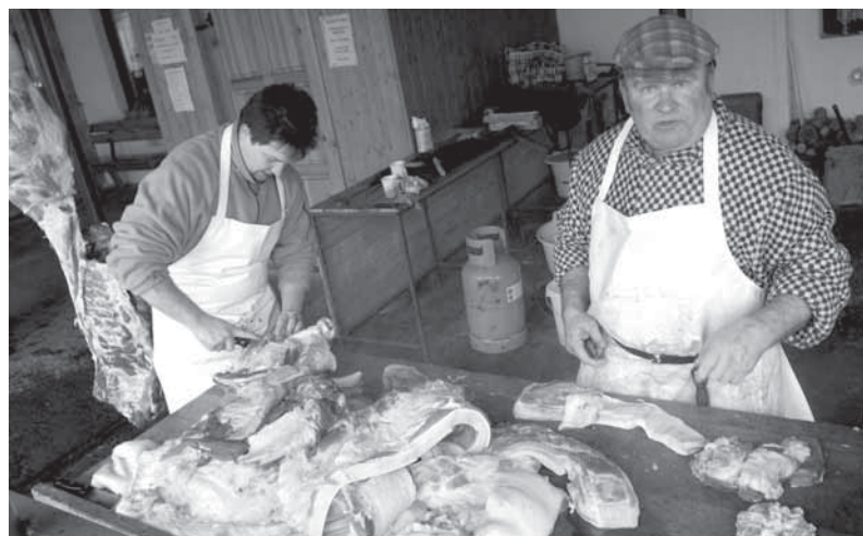
Zabijačka na Vápenkách v roce 2007