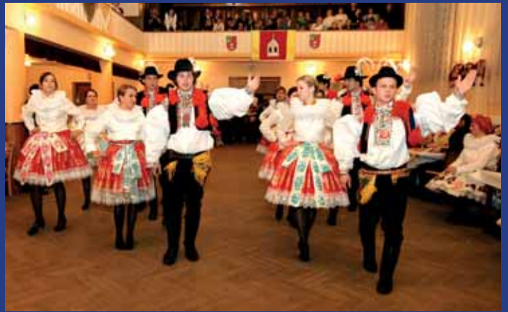
Na krojovém plesu v Blatnici zatančila také chasa