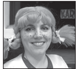
Zpravodajství 23, 24, 25 Novinky z Ostrožské Lhoty