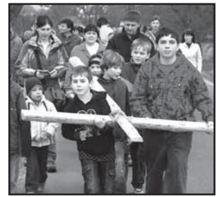
Velikonoce 8, 9, 10 Velikonoce dříve a dnes