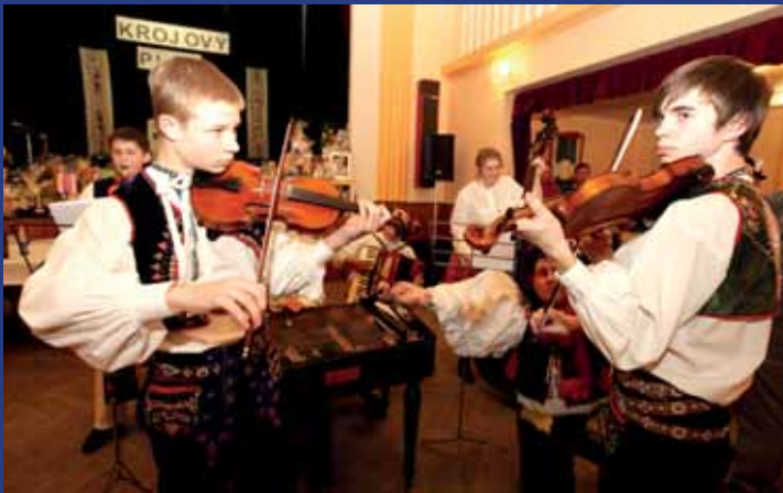
Dolňácká cimbálová muzika Blatnická Studánečka představila zakládací listiny muziky