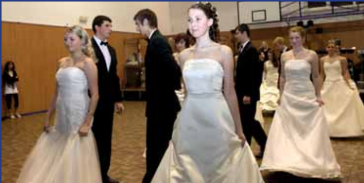
Školní ples v Ostrožské Nové Vsi