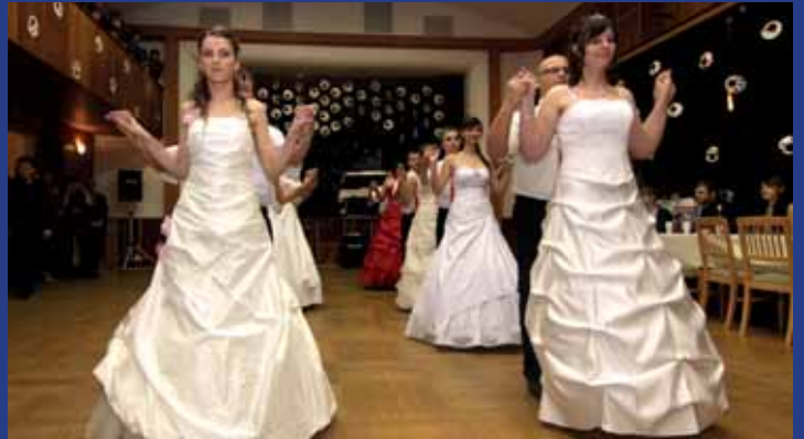
Rodičovský ples v Ostrožské Lhotě