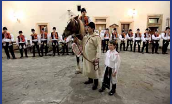
Na nádvoří Tvrze v noci při Krojovém plesu přijel v noci i nastrojený kůň