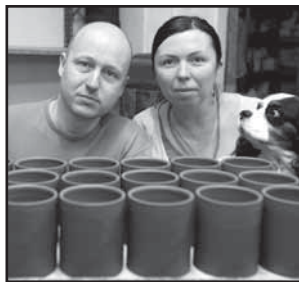
Řemeslníci 20, 21 Povídání s keramiky z Uherského Ostrohu