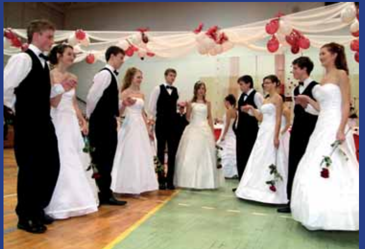
První velká taneční premiéra školáků v Hluku