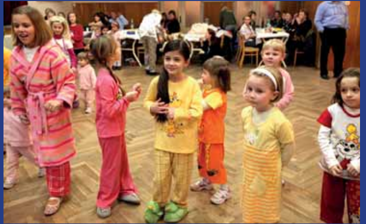
Pyžámkový ples se v Boršicích vydařil