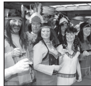
Nová Lhota 22 Indiáni na Vápenkách