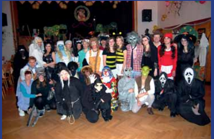
Spoustu legrace připravily ženy na maškarním plesu v Nové Lhotě