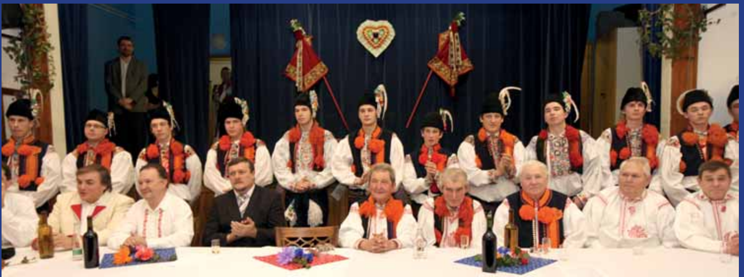
Těsně pod pódiem seděli bývalí králové a za nimi se řadili členové letošní královské družiny