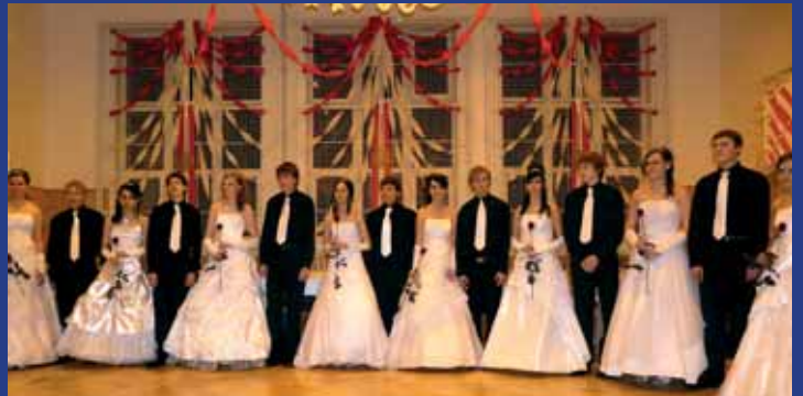
Rodičovský ples v Kuželově