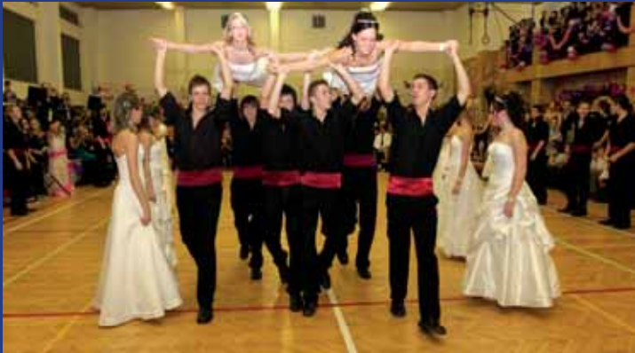
Ples SRPŠ v Uherském Ostrohu