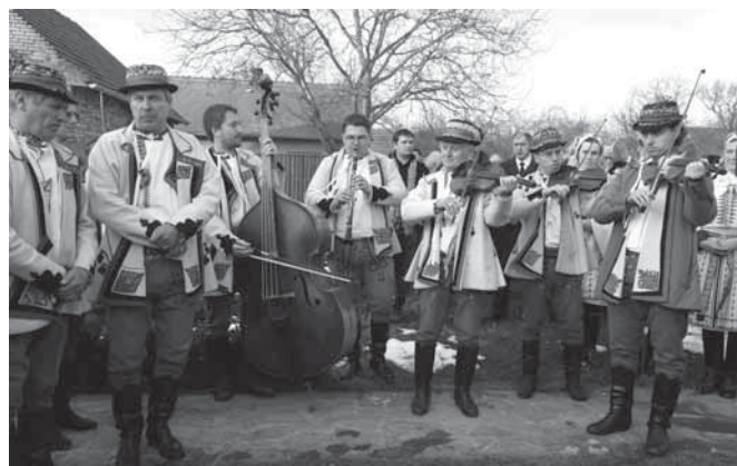
S kamarádem se přišli zpěvem a hudbou rozloučit muzikanti a zpěváci