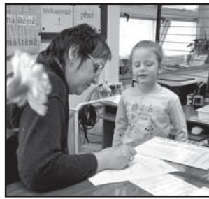
Louka, Nová Lhota, Kuželov 4 Zápisy do prvních tříd