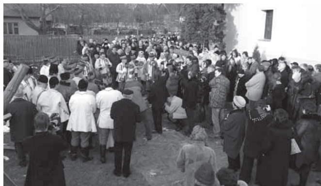
Po smutečním rozloučení v evangelickém kostele nikdo nespěchal domů