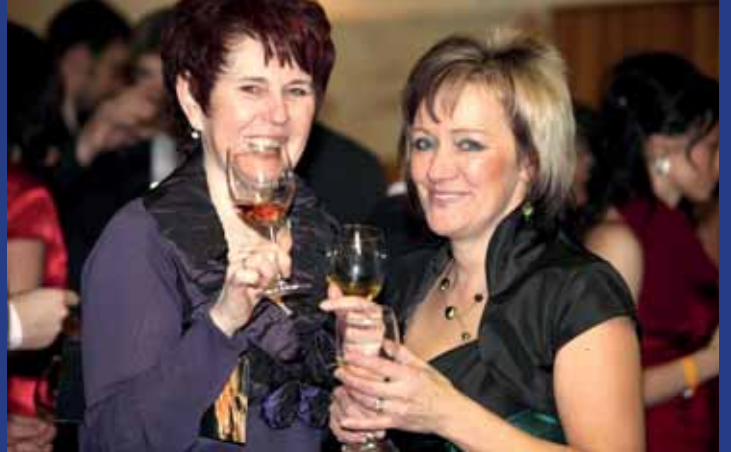
Na Vinařském plese si na vínu pochutnávaly i ženy