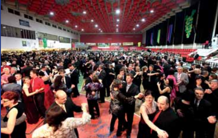
Bezmála dva tisíce lidí přišly na Vinařský ples do Hluku