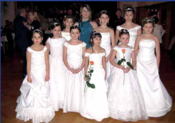
V Nové Lhotě tančí polonézu žáci prvního i druhého stupně