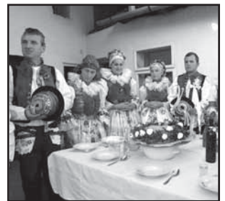
Ostrožsko-Horňácko 33 - 38 Zpravodaj MAS