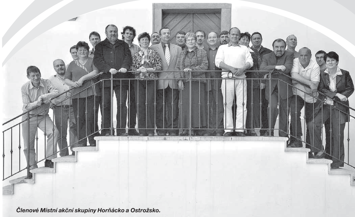
Členové Místní akční skupiny Hornácko a Ostrožsko.