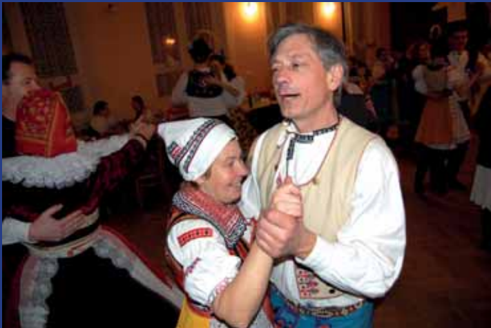
Jediný krojový ples na Horňácku byl i letos v Javorníku