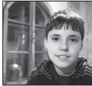
Tradice 15 Hlučané zbrojí na Jízdu králů