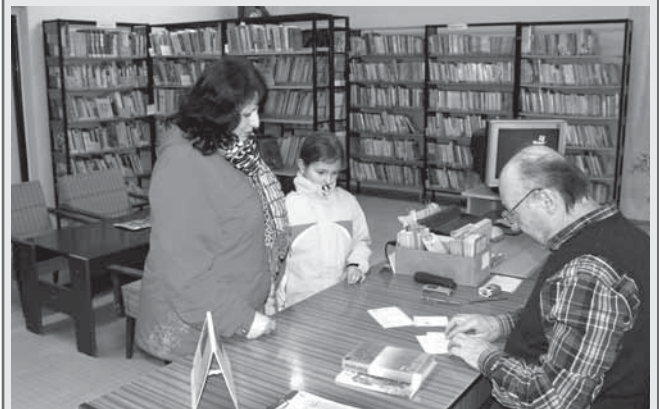
O čtení je v Louce zájem