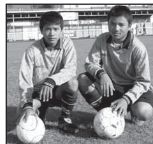
Sport 29, 30, 32 Za Hluk hrají fotbalisté z Barmy