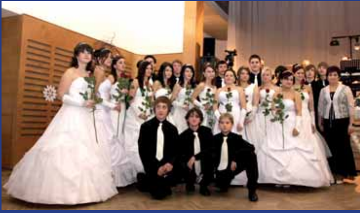
Předtančení školáků v Lipově bývá každoročně na vysoké úrovni