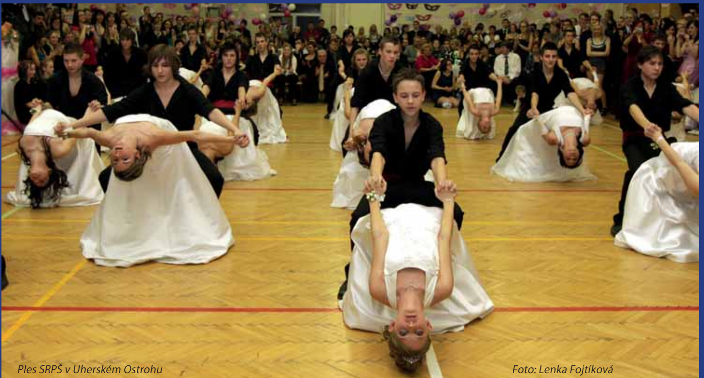
Ples SRPŠ v Uherském Ostrohu