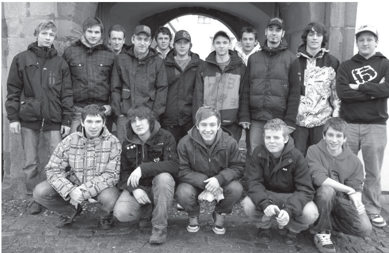
Tito kluci přišli v lednu na první schůzku jezdců, kteří mají usednout 3. července na koně při Jízdě králů

(Na www.mestohluk.cz můžete veškeré přípravy na slavnosti a Jízdu králů sledovat.)