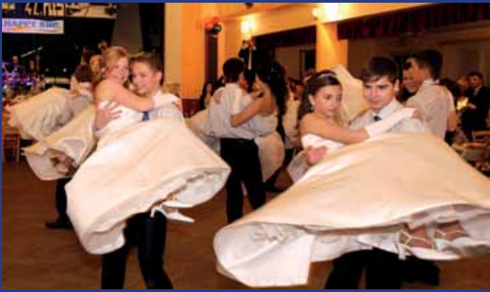
Školní ples v Blatnici pod Svatým Antonínkem