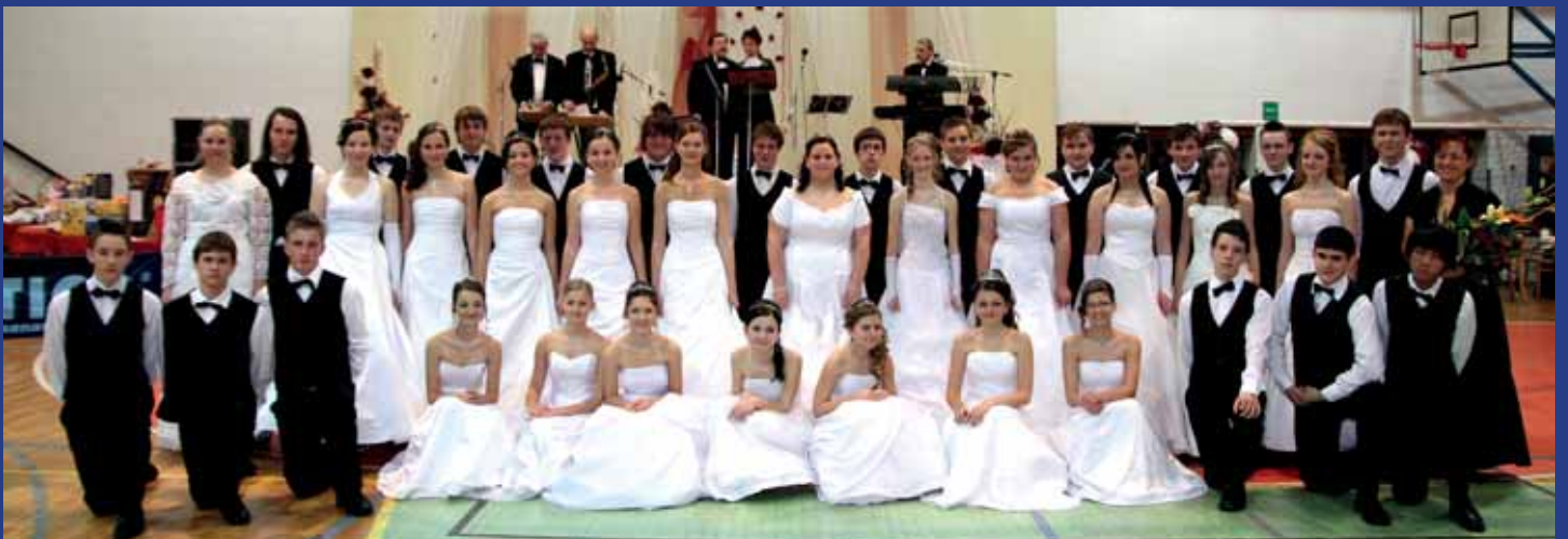
Společný snímek děcek z Hluku