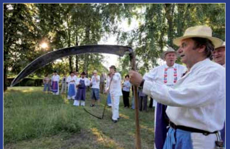
V Ostrožské Lhotě se zpívalo a kosilo.