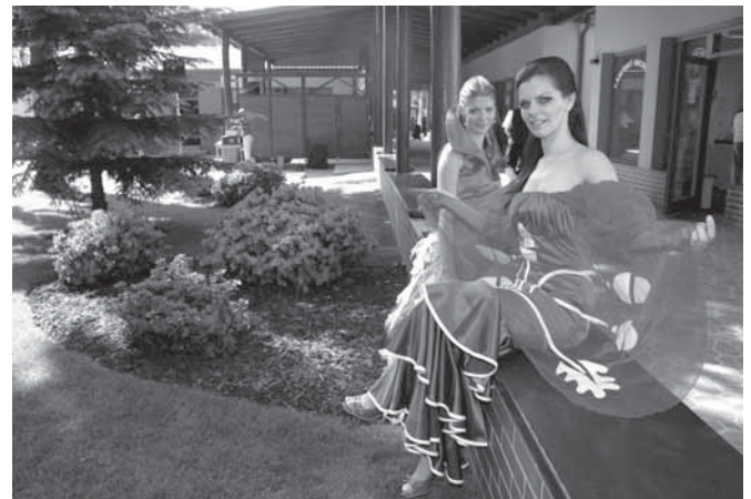
Modelky předvedly šaty znázorňující znak obce Ostrožské Nové Vsi a národní šaty v barvách České republiky se státními symboly.