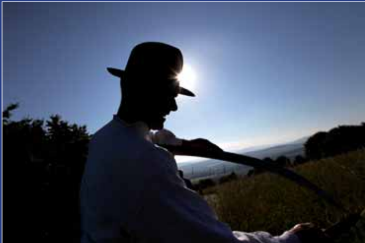
Na sekáče pálilo ostré slunce.