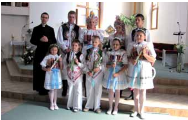
První svaté přijímání v Louce.