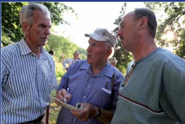
Odborná porota hodnotí, kdo svůj dílek nejlépe pokosil.