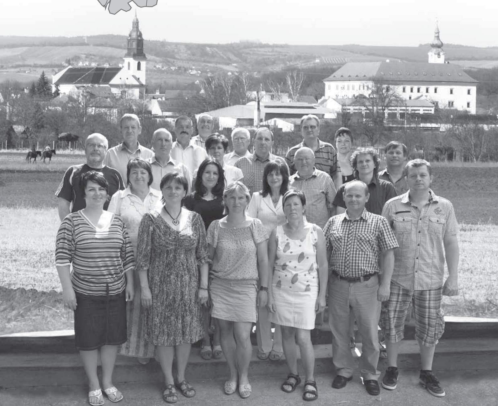
Členové Místní akční skupiny Hornácko a Ostrožsko

ZŠ Kuželov v projektu MAS Hornácko a Ostrožsko