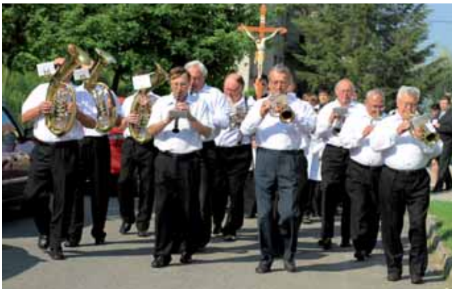
Stejně jako ve většině ostatních obcí i v Ostrožské Lhotě přivedla při prvním přijímání děti do kostela dechovka.