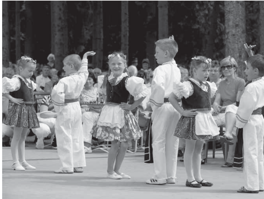
Lázeňské zpívání zahajovaly děti z mateřské školy.

ležitosti Dne matek předvedly maminkám. Písničky jsou proto