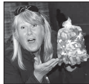
Velká nad Veličkou 16 Volba klobásového krále