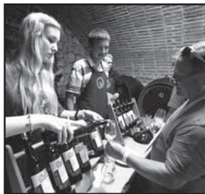
Blatnice 11 Putování z budy do budy