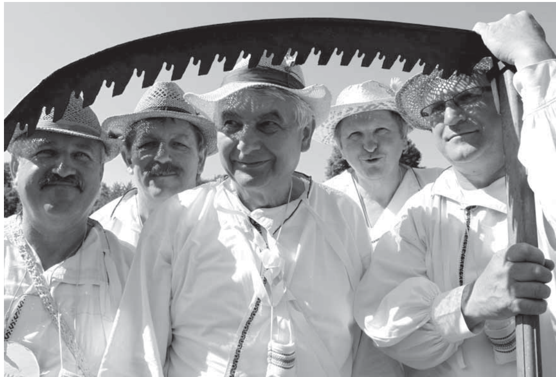
Parta z Velké nad Veličkou přišla se starou kosou, která určitě nesloužila ke klasickému kosení trávy.

už hodně slyšela, ale letos jsem se sem dostala poprvé. Setkala jsem se s velmi milými lidmi. Nejvíce se mně na celé akci líbí, že je taková spontánní. Není sešněrována žádným programem, který by museli účastníci dodržovat.