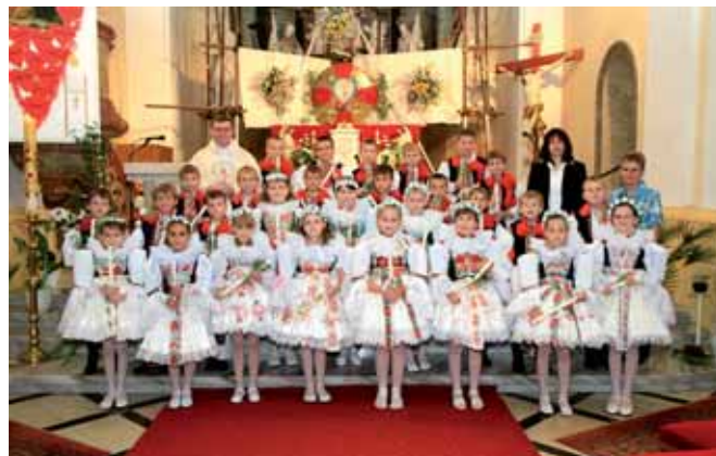
První svaté přijímání v Hluku.