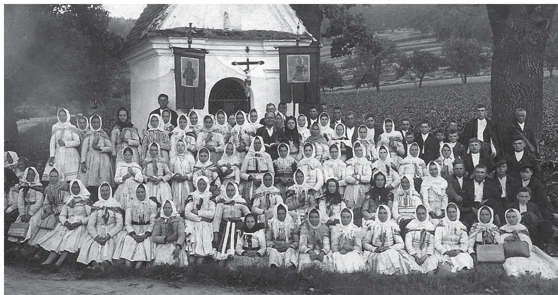
Takto putovali pěšky na Sv. Hostýn poutníci z Ostrožské Lhoty ve třicátých letech minulého století.