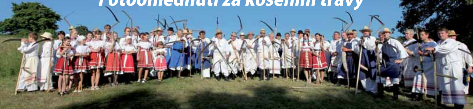
Společný snímek všech krojovaných účastníků při Horňáckém kosení na Vojšických loukách nad Malou Vrbkou.