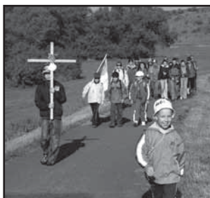
Ostrožská Lhota 21 Fenomén putování