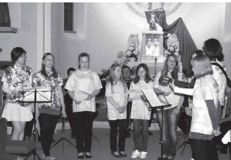
Při Noci kostelů v Blatničce zazpívaly také Světlušky ze sousedních Boršic u Blatnice.