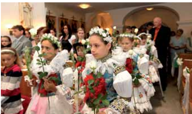
První svaté přijímání v Boršicích u Blatnice.