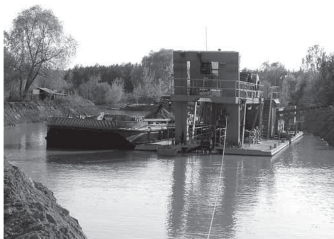
Pokud by došlo na katastru Uherského Ostrohu k těžbě, tak by se podobné stroje zařizly do zemědělské půdy.

studii EIA, což je studie, která posuzuje vlivy zamýšlené činnosti na životní prostředí. Víme, že si ji firma Jampílek nechala vypracovat. V současné době však zatím nemáme informaci o tom, že by byla hotová a jak zní její výsledek.