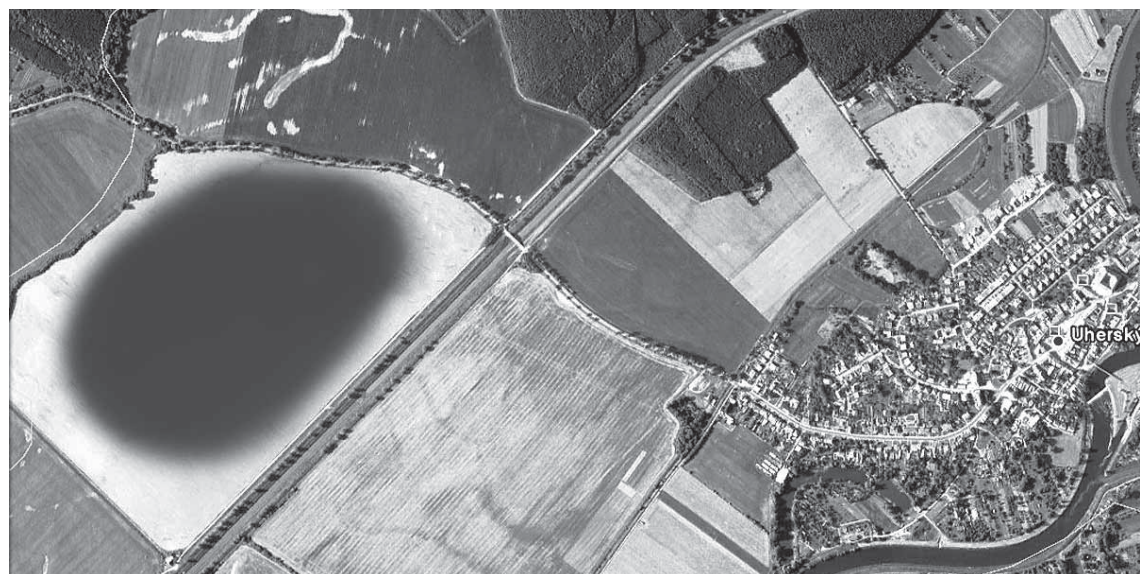
Nový dobývací prostor má mít přibližně rozlohu plochy, o které se výhledově uvažuje jako o rekreační zóně mezi Uherským Ostrohem a Ostrožskou Novou Vsí.

„To musí zodpovědět právě zmíněná EIA. Já mohu říci jen to, že zmíněná plocha leží na hranici tří katastrů. Příjezdová cesta má přitom vést místem, kde sousední Moravský Písek plánuje zřídit klidovou zónu, což by ji zcela jistě narušilo.“