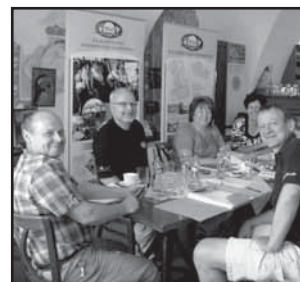
Ostrožsko - Hornácko 33-38 Zpravodaj MAS