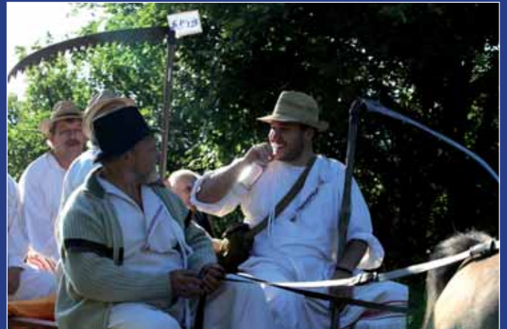
Ke kosení patří i doušek lahodné slivovice.