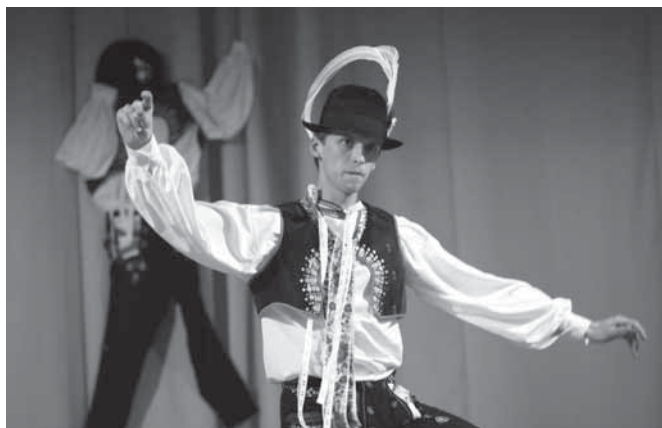
FS Lipovjan, o. s.: Regionální kolo Soutěže o nejlepšího tanečníka slováckého verbuňku Hornácka, Strážnicka a Veselska, 14. května 2011, Lipov

„Když se řekne Folklorní fond MAS Hornácka a Ostrožska, tak si většina kulturních aktivistů a folkloristů na Ostrožsku i Hornácku vybaví neotřelé akce, které vznikly v posledních letech (Boršická svajba, Hornácko, poznej folklor sousedního Ostrožska, Cestami suchovských republikánů, Regionální verbířská soutěž, Virtuální cimbálová muzika, Humor – koření našeho života, Malí verbíři (Dětské hody), Drapte, drapte, drapulenky…). S novými pořady vznikla ruku v ruce nová přátelství se zpěváky, zpěvačkami, tanečníky, dalšími jednotlivci i soubory z našeho okolí. Přátelství trvají, lidé se i nadále vzájemně navštěvují, dokonce postupně padají bariéry obou regionů. Hornácké soubory účinkují na Ostrožsku a naopak. Hornáci Ostrožanům for-