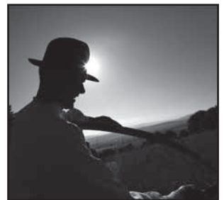
Hornácko, Ostrožsko 39 Fotoreportáž z kosení

Krajem svatého Antonínka , regionální periodikum, povoleno Ministerstvem kultury ČR pod č. MK ČR E 18131, vydává Mikroregion Ostrožsko, Uherský Ostroh, PSČ 687 24 • Redakce: Lenka Fojtíková (fojtikova-l@seznam.cz, tel. 777 331 582 a 774 831 582), Radek Bartoniček, Antonín Vrba, Stanislav Dufka • Jazyková úprava: Mgr. Zdeňka Pokorná • e-mail: mikroregion@ostrozsko.cz, www.ostrozsko.cz , cena výtisku 20 Kč • Design, grafické zpracování: Grafické studio Joker, Uherské Hradiště • Tisk: Joker, s. r. o., Masarykovo nám. 35, Uherské Hradiště, tel. 572 551 155. • Foto na titulní straně: Poutnice z Ostrožské Lhoty na Antonínku. Uzávěrka pro posílání příspěvků do dalšího čísla: 15. srpen 2011