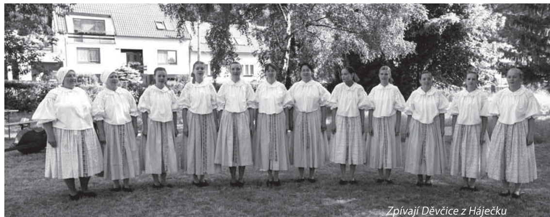
Zpívají Děvčice z Háječku