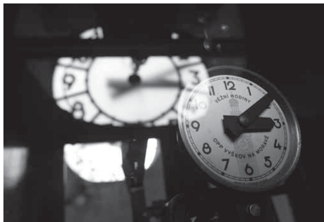
Ve věži mohli návštěvníci vidět i takový netradiční pohled na hodiny a jejich mechanismus.

ně na dudy. O půl hodiny později zazněl varhanní koncert Tomáše Fafleka, jehož doprovodil chrámový sbor z Blatničky. Kulturní program zakončil kvintet dechové hudby Blatnička a schola