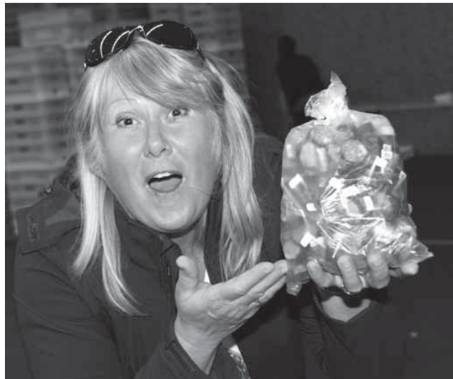
Nakrájené klobásy, které zbyly, si mohli návštěvníci vzít domů.

zabezpečeno a zajištěno. V den samotného koštu je do ní za-