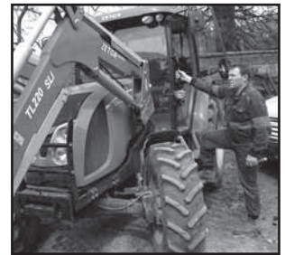
Javorník 18 Řezník Kružica ekologem