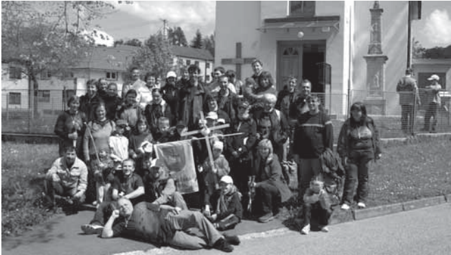
Poutníci z Ostrožské Lhoty, kteří počátkem května putovali pěšky do Kaňovic na Zlínsku, ušli celkem 37 km.

Druhou květnovou neděli se třicet Lhoťanů ve věku od sedmi do třiašedesáti let vydalo na pěší pouť do Kaňovic. Novodobí poutníci obnovili putování v roce 2008. Od té doby nevynechali jediný rok, kdy by se někam nevydali pěšky.