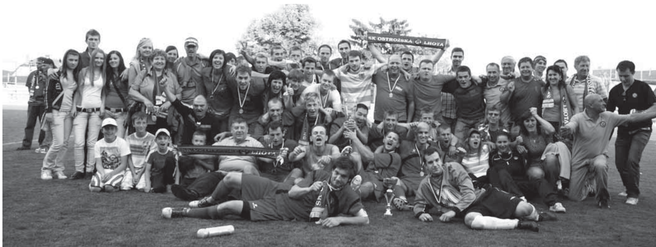
Fotbalisté Ostrožské Lhoty vybojovali po sedmnácti letech pohár Okresní fotbalové soutěže Uherské Hradiště, a tak měli důvod k obrovské radosti.