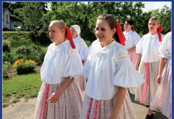
Ozdobou Antonínkového kosení byly Děvčice z Háječku.