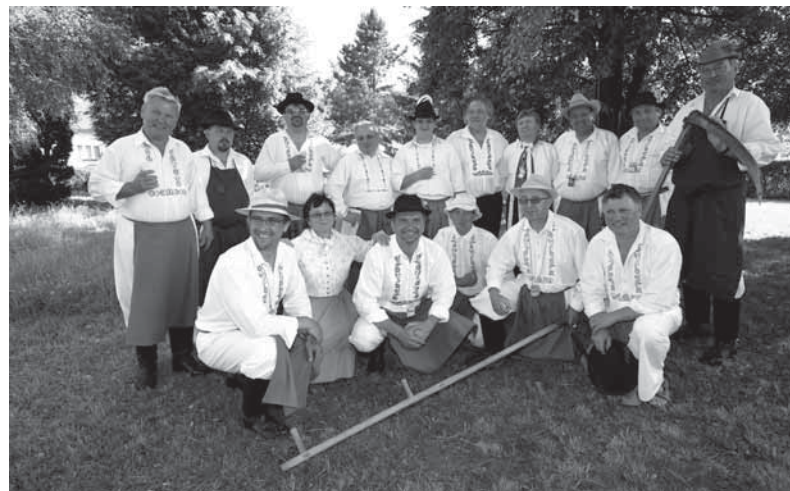
Kosení uspořádal mužský pěvecký sbor z Ostrožské Lhoty.