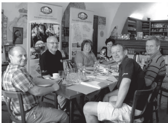
Veřejná obhajoba - Výběrová komise MAS

Nakonec uspělo k zaregistrování na RO SZIF Olomouc 13 žádostí. Celková výše dotace všech 13 projektů dosahuje částky 4 695 957 Kč, z toho: