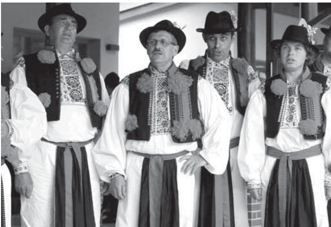
Při zpívání v lázeňském parku nemohli chybět domácí Krasavci, kteří celou akci pořádali.