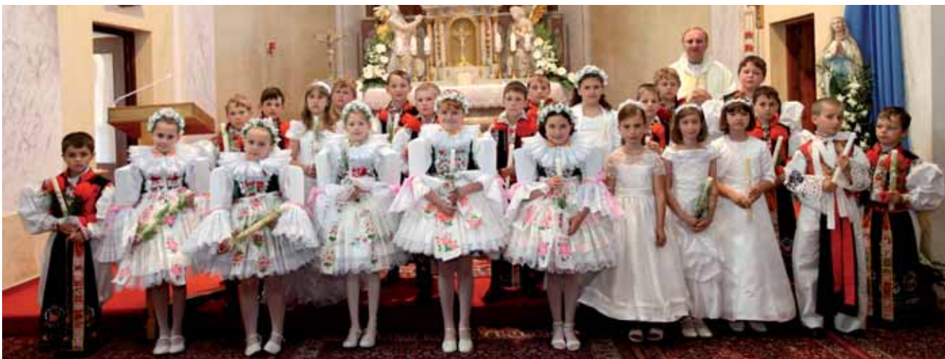
Při prvním svatém přijímání v Blatnici děti hledaly poklad.