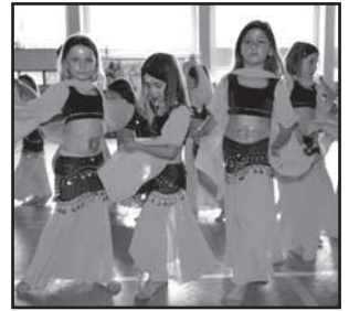
Uherský Ostroh 10 Světlo Orientu na Slovácuku