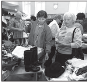
Ostrožská Nová Ves 7 Burza krojů nabídla skvosty