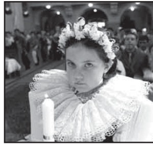
Ostrožsko, Hornácko 9 Fotoohlednutí za první svatým přijímáním