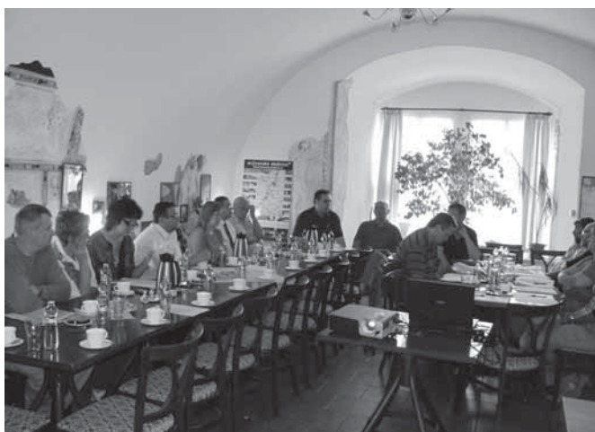
Veřejná obhajoba - žadatelé

Po registraci na MAS probíhala administrativní kontrola žádostí. Všechny žádosti měly doloženy povinné přílohy a splnily kritéria obsahové správnosti a přijatelnosti. Nelehký úkol čekal šestičlennou výběrovou komisi. Každý člen komise hodnotil 9 žádostí, aby byla splněna podmínka – každou žádost musí hodnotit min. 3 hodnotitelé. Při hodnocení výběrové komisi velmi pomohla i veřejná obhajoba projektů, kde žadatelé prezentovali své projekty, a výběrová komise kladla doplňující dotazy k jednotlivým projektům. Žadatelé měli velkou snahu bojovat o svůj projekt, o čemž svědčí, že o obhajobu mělo zájem 15 žadatelů z 18.