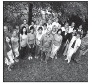
Hornácko, Ostrožsko 5 Rozjíždí se projekt Školy pro venkov