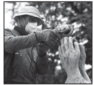
Blatnička 6 Noc kostelů