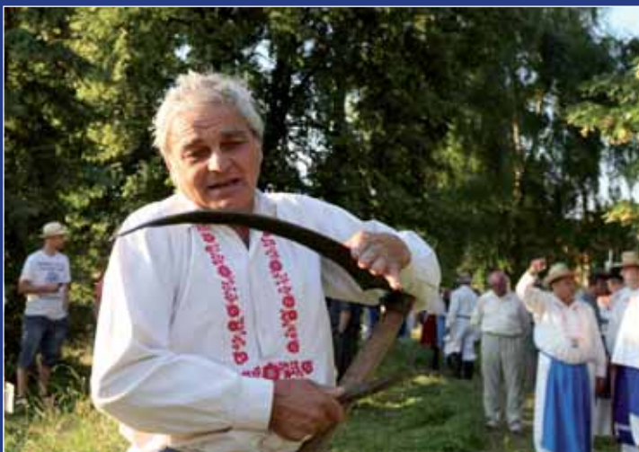
Po zpívání vzali v Ostrožské Lhotě do rukou kosy mladí i ti dříve narození.