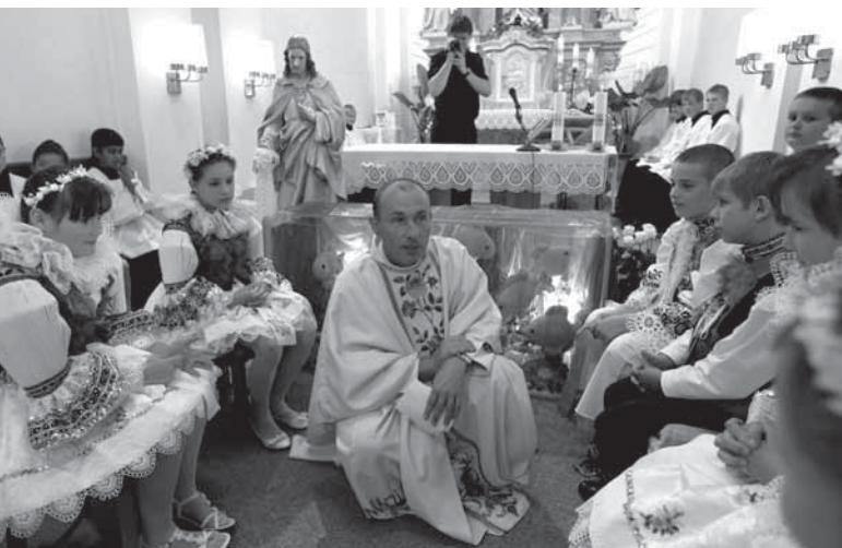
Při prvním svatém přijímání si pan farář s dětmi dlouze vyprávěl.