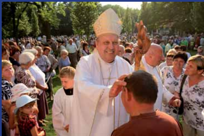
Biskup P. Pavel Posád rozdával při Domácí pouti na všechny strany úsměvy i požehnání.