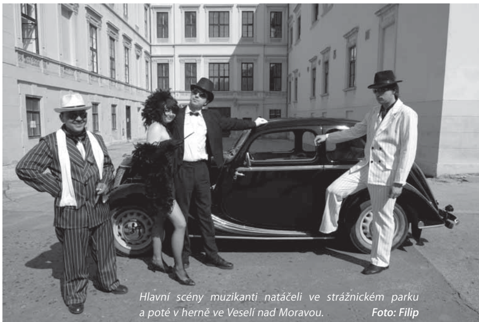
Hlavní scény muzikanti natáčeli ve strážnickém parku a poté v herně ve Veselí nad Moravou.

„Když jsem projížděl různá místa a hledal, kde bychom mohli točit, tak mě platanová alej s černou