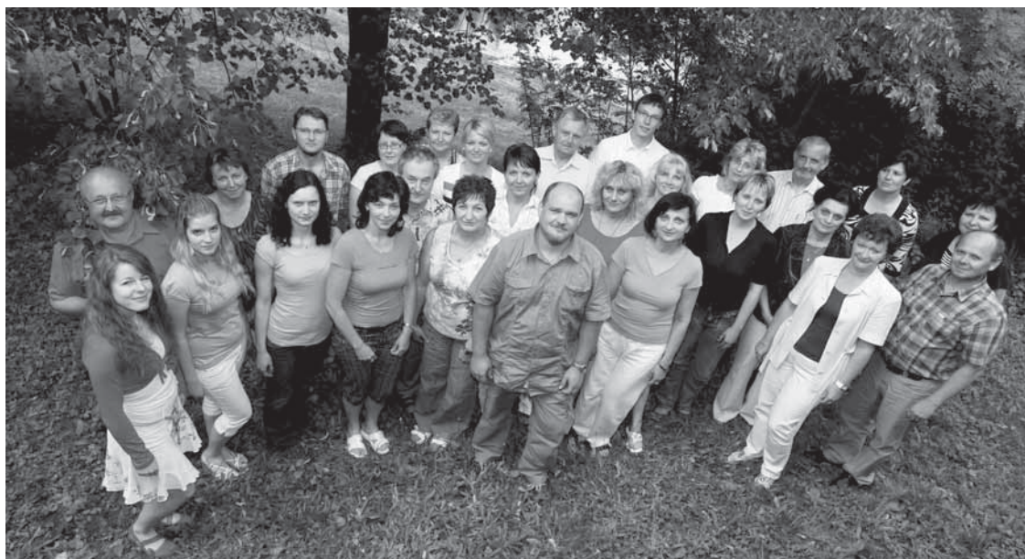
Společný snímek všech, kdo se v MAS Horňacko a Ostrožsko zapojili do projektu Školy pro venkov.