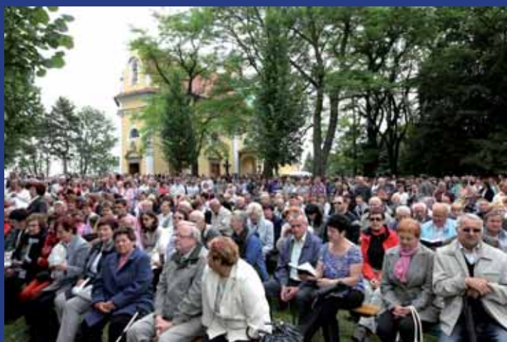
Při Hlavní pouti na Antonínku připutovaly nepřehlédnutelné davy lidí.