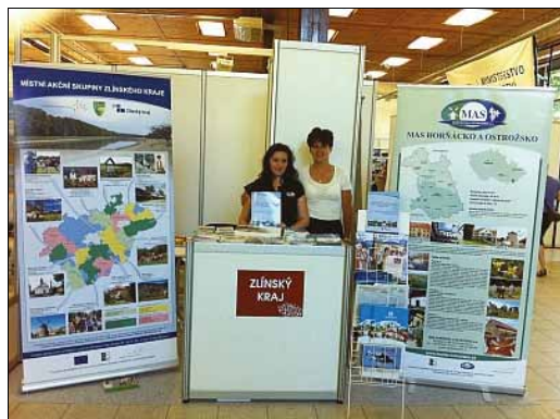
Země živitelka 2011, České Budějovice

+ venkovské tržnice a košty v rámci projektů spolupráce