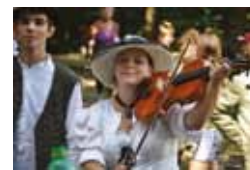
Cestami suchovských republikánů