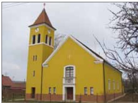
Obnova fasády kostela, Hrubá Vrbka