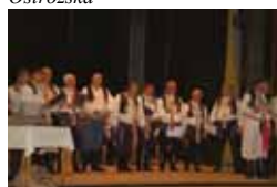
Adventní koncert, Louka