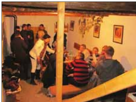
Pracovní porada MAS ZK, únor 2011, Blatnice

V roce 2011 proběhly 3 pracovní porady MAS Zlínského kraje a dva semináře na téma Evaluace.