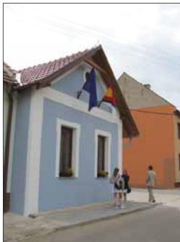
Víceúčelový dům, Ostrožská Lhota

Fiche 4 – Ochrana a rozvoj kulturního dědictví venkova - byla vyhlášena ve dvou výzvách. Podle finančního plánu SPL bude Fiche vyhlášována do konce roku 2013.