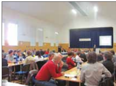
Setkání všech 3 MAS za účelem výměny zkušeností v Ostrožské Nové Vsi, 3. listopadu 2011

Uzavřena smlouva s vítězným dodavatelem na obnovu památkového domečku, zahájení stavebních prací.