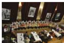
Před tů svatú goralenkú...Boršice