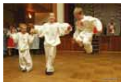
Cíťování, FS Háječek