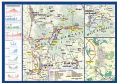
Náhled na mapu běžkařských tras