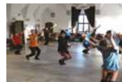
Do tajů verbuňku, Slovácké variace