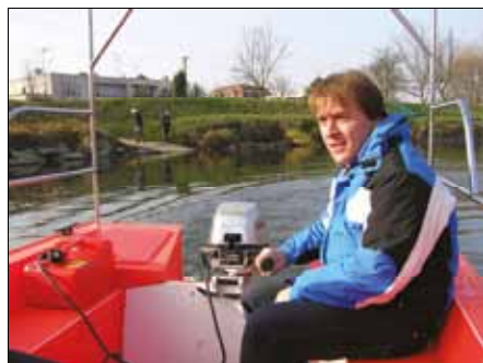
Půjčovna lodiček, Mikroregion Ostrožsko