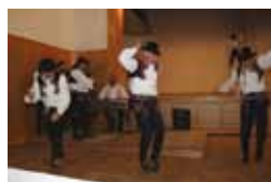
Verbírská soutěž, Lipov

Rekapitulace 1. – 4. výzva ... podpořeno 52 kulturních akcí, mezi které se rozdělila částka 370 000 Kč.