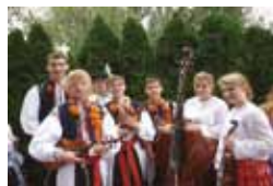
Výuka verbuňku, Blatnická studánečka Ostrožska