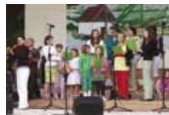
Koncert na Blatnické hoře