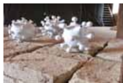
Výstava Hornácké múzy, Velká