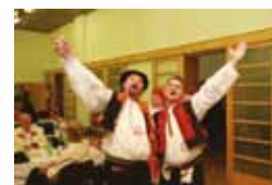
Hornácko, poznej folklor sousedního Ostrožska, Lipov