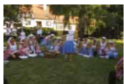
Antonínkové sečení, Ostr. Lhota