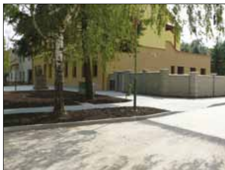
Komunikace a parkoviště, Velká nad Veličkou