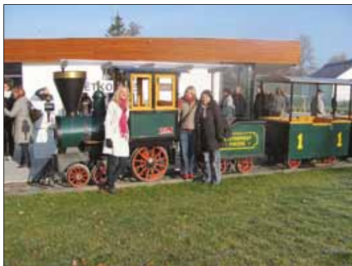
Konference venkov 2011 - exkurze