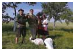
Putování pohádkou, Ostrožská Lhota