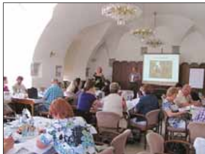
Seminář pro pedagogy na tvorbu regionálních pracovních sešitů, květen 2011, Uherský Ostroh

2 - 12/2011 - Školy pracují na sběru informací pro regionální učebnici, pracovní sešit a pracovní listy, vydávají vlastní časopisy