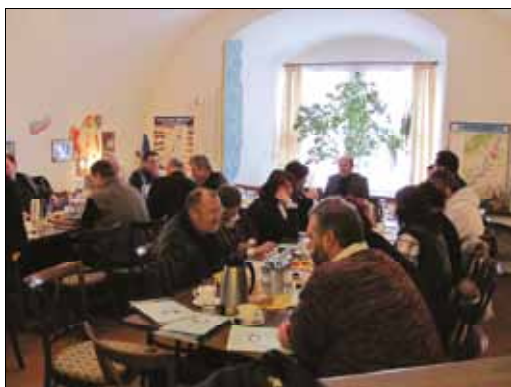
Jednání Valné hromady MAS Horňácko a Ostrožsko ze dne 28. 1. 2011

Jedná se úpravy, které napomohou ke sjednocení stanov s Pravidly PRV ČR 2007-2013. Zásadní změnou je změna kompetence manažera a předsedy MAS, obecnější forma jmenování čtyř zástupců z Mikroregionu Ostrožsko a z DSO Horňácko, změna počtu osob v Programovém výboru z 5 na 6 osob a to z důvodu dodržení principu tripartity (podnikatel, nezisková organizace, starosta), změna období ustavování orgánů sdružení na období 3leté (původně 4leté). Usnesení VH bude přijato, jestliže se pro ně vysloví nadpoloviční většina všech hlasů členů MAS. Všichni členové MAS budou mít povinnost účastnit se jednání valné hromady. Statutární zástupci jsou zároveň členy programového výboru nebo výběrové komise.