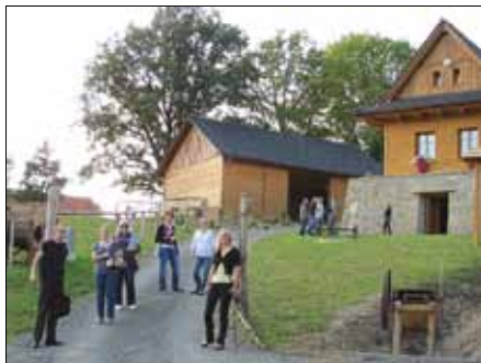
Pracovní porada MAS ZK, září 2011, Vysoké Pole